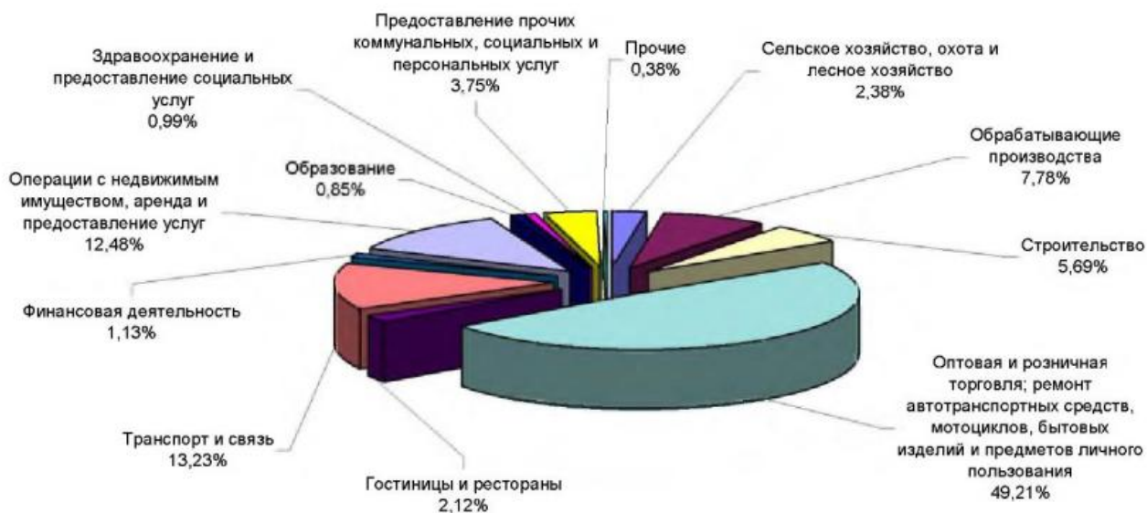
Распределение сфер деятельности в малом бизнесе (включая предприятия и индивидуальных предпринимателей) по Зеленодольскому муниципальному району по состоянию на 01.01.2014 г.

Наибольшее количество субъектов малого и среднего предпринимательства в Зеленодольском муниципальном районе заняты в сфере оптовой и розничной торговли.